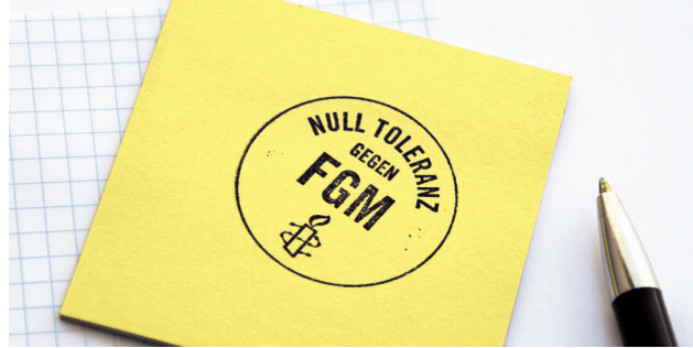
Ein Zeichen setzen gegen weibliche Genitalverstümmelung weltweit

Weibliche Genitalverstümmelungen/-beschneidung ist eine Menschenrechtsverletzung!